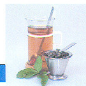
Tee ohne Zucker